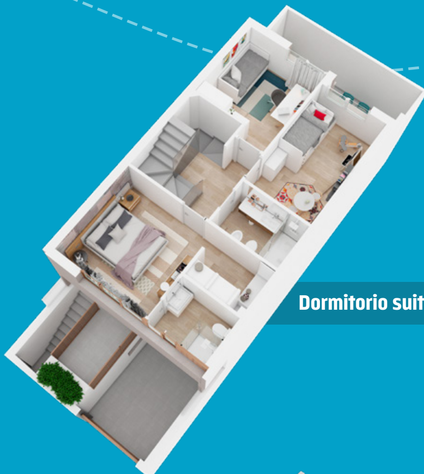
Dormitorio suite con vestidor