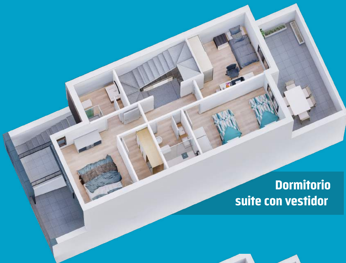
Dormitorio suite con vestidor